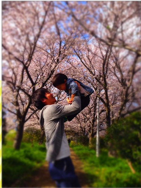
息子が生まれる日、眠れずに早朝歩いた桜並木。 こんなに大きくなったよ♪桜にご報告！ これからもずっと大事にしたい素敵な場所です。