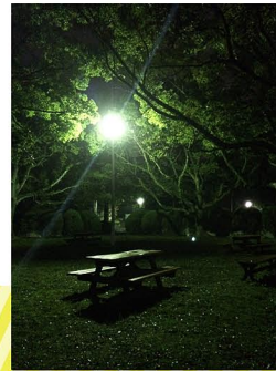
学校のダイヤモンド広場です