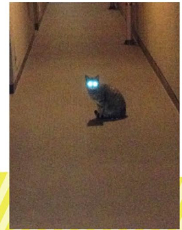
アパートの廊下にあったネコちゃん 可愛い〜と撮ったら 怖い結果に。。。 でも癒される♡